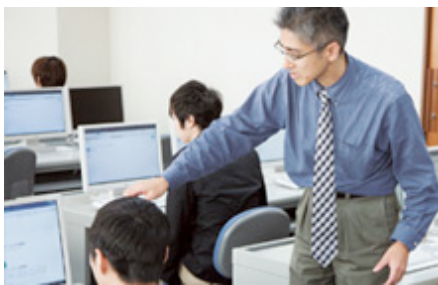
プログラミング応用実習