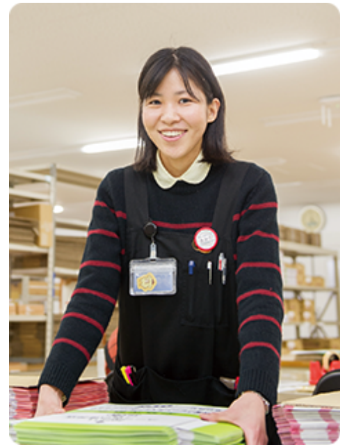
株式会社高崎共同計算センター

メインのお客さまは小売業のため、社会人になって日商販売士2級の資格を取得しました。今の目標は、デザイン提案に活用できる色彩検定2級。知識やスキルの幅が広がっています。